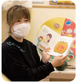
毎月のテーマに沿って選定された「おりようりえほん」

際のかぼちゃを観察し食材への好奇心を育成。おやつは、クックパッドアライアンス企業の材料を使用した「バックde蒸しパン」が「ぼちゃ味」です。調理の手本を見た後、園児たちは自分たちのおやつと保護者へのおみやげづくりに挑戦。様々な体験を通じて、食への興味や楽しさを引き出し、食が魅力です。