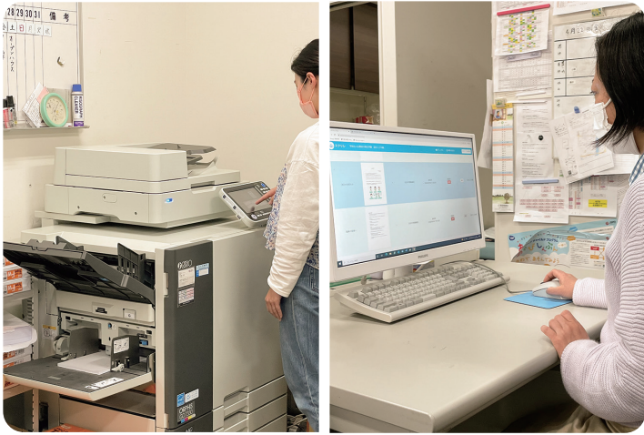
オフィスの高速プリントとスクリレの即時配信で、プリント時間の短縮と保護者へのスムーズな連絡を実現

「オルフィス」の高速カラープリンター「オルフィス」とデジタル連絡ツール「スクリレ」を活用し、職員の業務効率化と保護者の満足度向上を実現する流川こども園にお話を伺いました。 126名の園児が通う同園では、園だよりや保護者説明会の資料、運動会のプログラム、教材など、全園児への配布物は、1回当たり約150枚近くにもなります。そうした園のプリントを支えているのが同社の「オルフィス」です。