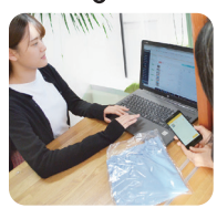
用品もアプリで注文 口座引落で受取のみ

2021年9月、木の実幼稚園(埼玉県)は、預かり保育料や用品代金を現金集金から口座引落に切り替えました。導入したのは、園務効率化システム「LeySerKids」。園児管理や出欠管理、保育料計算、指導要録の作成に加え、保護者へのお知らせ配信、預かり保育の申込受付などが手軽にできるシステムです。同園における以前の預かり保育料の管理方法は、保護者が回数券を園の窓口で