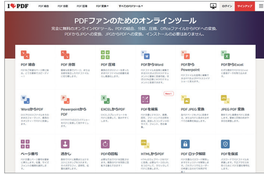
「iLovePDF」の画面。PDF結合や分割の他、様々な操作も可能 https://www.ilovepdf.com/ja

園のホームページに、保護者アンケート結果や自己評価、学校評価、財務情報などの情報をPDFにて掲載する際、「PDFのページだけを掲載したい」「複数のPDFを一つにまとめた」といなど、出力・保存方法についてご相談をいただくことがあります。PDFファイルを分割したり結合したりするには、ソフトやWebサービスを利用しましょう。