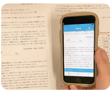
スクリレで保護者のスマホへタイムリーに届くおたより

「スクリレで配信。さらに、スクリレで配信して既読にならなかった場合は、オルフィスでプリントしたものも保護者に直接手渡しするなど、紙とデジタルのそれぞれのよさを活かしながら使い分けをしています。園と家庭のつながりを大事にしている同園の心遣いを感じました。」