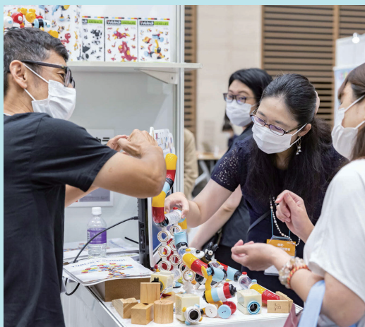
展示会場には、家具・什器類から防犯、業務効率化のシステムなど様々な製品・サービスが集結

感染防止対策として来場者数管理を行うため、入場および聴講には「来場事前登録」が必須です。詳しくは保育博公式サイトへ。