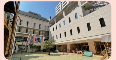
流川こども園(広島県)

紙とデジタルの併用で 職員の業務効率化と 保護者満足度の向上を実現 家庭と子どもの成長を分かち合えるよう、つながりを大切にしている流川こども園。同園では、理想科学工業(株)のプリンターとデジタル連絡ツールを併用し、プリント時間の短縮と保護者へのスムーズな連絡を実現しています。