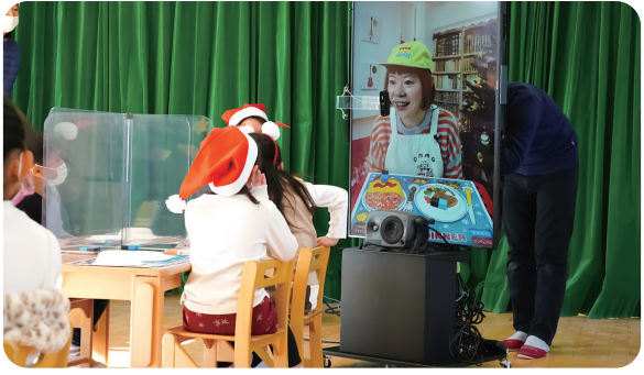
写真は、今回使用した、ソニーのテレプレゼンスシステム「窓」。目の前にいるかのように会話が弾む

2021年12月、國學院大學附属幼稚園（東京都）では、「いきなりDJでクリスマスパーティー」が開催されました。音楽と食、プログラミングを織り交ぜたワークショップイベントの様子をお届けします。