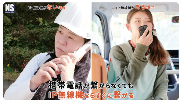
バスでの送迎時や散歩中など、日常の連絡手段をIP無線機にすることでいざという時にも焦らず連絡

東日本大震災から11年。IP無線機や緊急地震速報機を通じ、数多くの園の防災対策を支援している(株)ニシハタシステムに、防災対策のポイントを聞きました。防災訓練は園児たちへの指導だけでなく、職員同士の連携も重要と語ります。