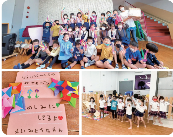
栄美幼稚園からは折り紙や手紙を、Little Gems Preschoolからはチャプターを贈り、交流を深めた

オンライン世界交流を実践した園の気づきを海外園の先生のお届け。第2回はシンガポール編。Little Gems Preschoolと栄美幼稚園（福岡県）の子どもたちとの交流レポートです。