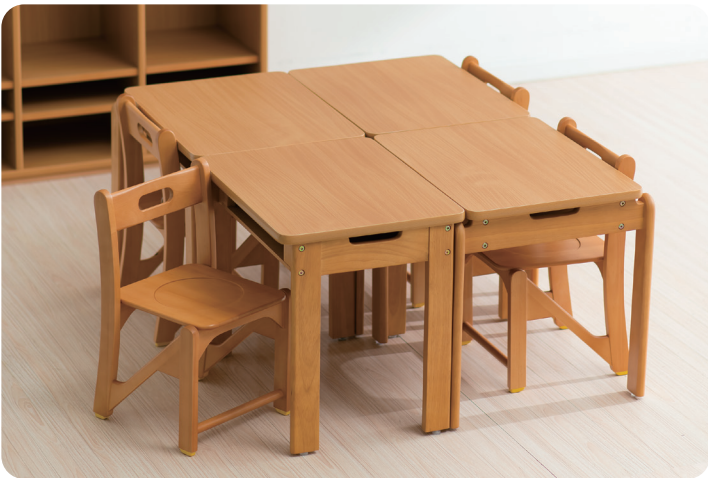
1人用机の「New H desk」。複数台を並べることで長机のような使い方も可能