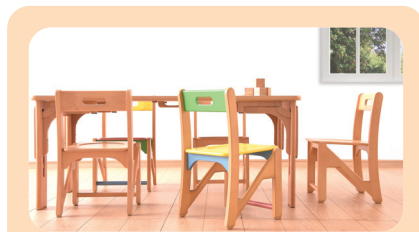
（株）浅井建築設計事務所（埼玉県） 保育家具「Kids Kagu」は、安全性や保育者目線の利便性、子どもの感性を育むようなデザインが特徴。2009年、2012年グッドデザイン賞受賞。無料貸出実施中。

これまでも、子どもが安全に持ち運べる軽さでありながら耐荷重100kgを超える強度をもつ椅子や、正しい手順でなければロックが外れない独自構造の折り畳みテーブルなどを開発。海外生産と少人数の組織体制で、従来の保育家具よりも安価で提供できるよう創意工夫を重ねてきました。 そしてその理念は、今回の新型コロナウイルス対策商品の開発や、保育者の使いやすさをより追求した既存商品のリニューアルにも表れています。必要とする人に行き