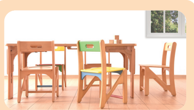
(株)浅井建築設計事務所(埼玉県) 保育家具「Kids Kagu」は、安全性や保育者目線の利便性、子どもの感性を育むようなデザインが特徴。2009年、2012年グッドデザイン賞受賞。無料貸出実施中。

「物価や労働者人口、インフラなどを複合的に考え、ベトナムでの製造を決めた。日本で認められる品質を保つために、言語や価値観の違いが壁となったが、自社工場ができてより安定して製造できるようになった」と、適正価格を実現するまでには苦労もあったそう。現在ベトナムには、日本人が常駐。家具をつくる傍ら、現地ワーカーが働くことを楽しいと思えるような空間をつくるとうと、敷地内に花や木を植えるなど環境改善もされているそうです。こうした、その空間にいる人を想うやさしさが「Kids Kagu」の魅力にも表れているのかもしれない。