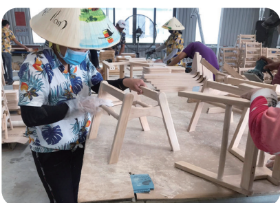
浅井ベトナム自社工場で働く現地ワーカーの様子

このスタッキング性能は、保育室のスペースを有効に活用できるだけでなく、園の減災対策につながるもの。スタッキングした椅子が倒れないように専用の固定具で壁に固定するものや、同様に壁に固定することで机そのものが収納ボックスの役割を担い、中に収納した椅子が散らばらないようにする家具などさまざま。また、子ども目線の安全性を考慮し、子どもがいたずらをしてもし正しい順番・動作でなければロックが外れない折り畳みテーブルなど、工夫が凝らされています。