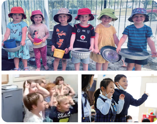
Aoraki Explorers 園の子どもたち。右下はオンラインで交流した明照幼稚園の子どもたちとの交流の様子

オンライン世界交流を実践した園の気づきを海外園の先生のお届け。第1回はニュージーランド編。Aoraki Explorers 園と明照幼稚園（神奈川県）の子どもたちとの交流レポートです。