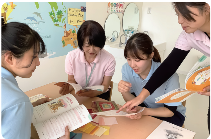
CRAYON BOOKで子どもの成長や保育環境を共有し、保育者同士が同じ目線で子どもへの関わりを考えている

(株)パソナフォスターは、子どもに関わるすべての人のコミュニケーションを促し、保育の質向上を支援する「CRAYON BOOK(クレヨンブック)」を全国展開。同社運営の保育園では、リリース前から、子どもを伸ばす指針として活躍されています。