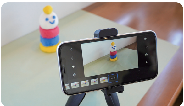
粘土の形や色が変わっていく過程をアプリで撮影するだけで、クレイアニメを作成できる方法を紹介

明星大学教育学部は2021年11月、第19回教育・保育セミナーを開催。参加した保育関係者など17名が、クレイアニメと呼ばれる粘土とスマートフォンを使ったストップモーション・アニメーションに挑戦しました。