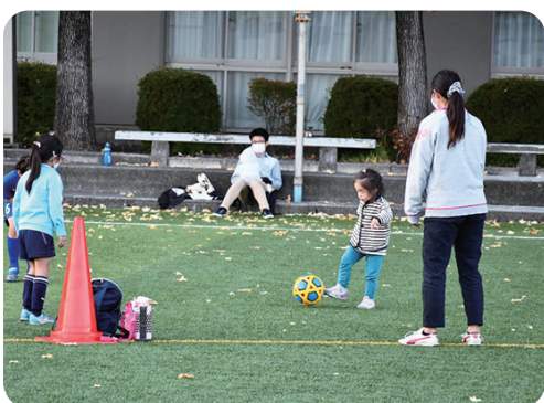
このイベントには年中児から小学6年生までの女兒とその保護者17組が参加し、藤枝順心高校サッカー部員も運営に協力しました。

全日本高等学校女子サッカー選手権大会で2連覇を果たした藤枝順心高校の人工芝グラウンドでは、2021年10月30日、NPO法人 JUNSHIN SPORTS CLUB が主催するイベント「親子でサッカーボールをつくろう！」が開催されました。