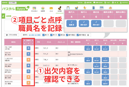
出欠状況と各項目の点呼記録を可視化 (パステルApps)

運送業向けの点呼システムはあるものの、園業務にあった点呼システムは見つけづらい……。そういったお声から、園児管理システム「パステル Apps」では、その日の出欠状況と連動した点呼表機能を取りました。