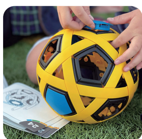
再生PP素材の組立式ボールキット「MY FOOTBALL KIT」