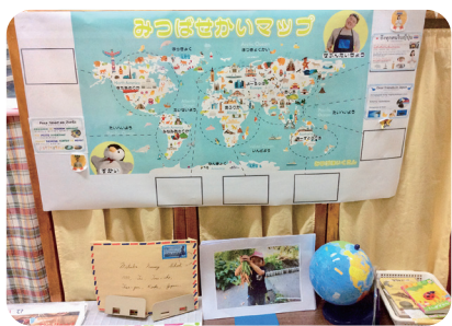
交流した国を可視化するマップを園内で掲示

一方で、フィリピンやブラジル、タイなど、さまざまな国を動画で巡る「ちきゅうフレンズ」は、園の負担が少なく実施できる動画視聴型のプログラム。約20分の動画では、現地の大人や通訳のペットがまるまると目の前にいるかのようの子どもたちにテンポよく話しかけます。両園は、この動画プログラムとオンライン交流を組み合わせて、全8回の動画プログラムを行う傍ら、オンライン交流を1、2回行うよう年間計画に組み込んでいます。