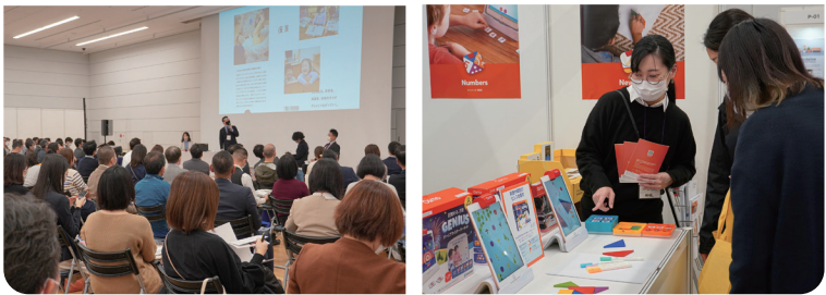
教育・保育活動をサポートする最新の製品・サービスと出会う展示エリアや、計21本の多彩なセミナーから情報収集する来場者の様子

2021年12月1・2日の2日間にわたり開催された「保育博2021」保育・教育ビジネス&サービースフェア」が盛況のうちに閉幕しました。保育博は、多様化する園の運営に必要な製品・サービスが並ぶ見本市と、次世代における教育のあり方や保育に必要な考え方を学ぶセミナーから、効率よく幅広い情報収集ができる場。今回は、過去最多の168社の最新の商材やITを駆使したサービスが一堂に集結し、保育業界関係者が多数来場しました。