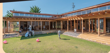
このはな保育園（三重県鈴鹿市） 土や植物、石、木などの自然を肌で感じられる園舎は第40回三重県建築賞「濱口賞」、第15回キッズデザイン賞「子どもたちを産み育てやすい部門」を受賞。