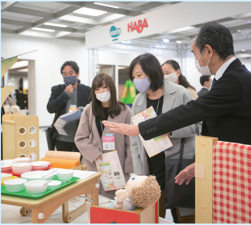
展示会場には、家具・什器類から防犯、業務効率化のシステムなど様々な製品・サービスが集結

業界の著名人による「主催者セミナー」が8本、園関係者の日々の業務に直結するテーマで業界のエキスパートが講演する「エデュケーションセミナー」が6本、さらに、出展企業約90社のうち5社による「出展者プレゼンテーション」など、出展企業との商談に加えて、2日間にわたる交流・学びの場から情報収集ができます。詳しくは「保育博ウエスト」で検索。