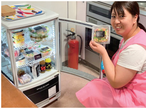
商品は1個100円〜とコンビニよりもお得

「1日350g以上」。これは厚生労働省が提唱する1日あたりの野菜摂取目標。しかし、栄養バランスの取れた食事を毎日摂ることはそう簡単ではなく、成増幼稚園では職員に対する食事