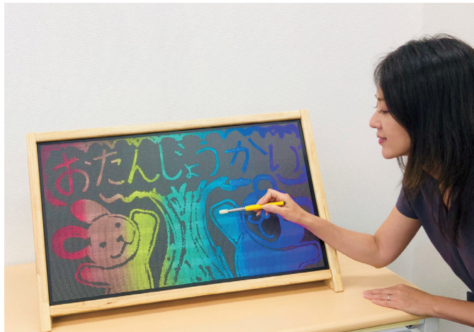
Beeboard ことも黒板ティーチャー (W746mm × H450mm × D80mm)

年齢や筆圧の強さに関わらずはっきりと美しい線が描ける「Beeboard (ビーボード)」。 ペンやチョーク不要で描ける構造や描き心地のよさから、子どもの自由な発想を可視化するツールとして 2020年に「子どもたちの創造性と未来を拓くデザイン部門」でキッズデザイン賞を受賞しました。 その使い心地をパステルIT新聞編集部が体感！その感想をレポートします。