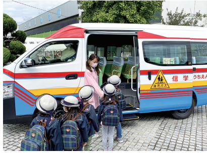
バスと制服は開園当初から変わらない信学会のシンボル

創立67年の歴史がある信学会は、長野県内で幼稚園16園、保育園6園、認定こども園1園の計23園を開園。「幼稚園に行きたい」という家庭の想いに応えようと、多くの園が開園当初から園バスを導入しています。