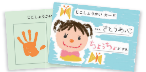
創作活動の教材づくりはアイデア出し、原稿作成、量産で分担

待機児童や人手不足などの課題を抱える保育の現場でも、働き方改革の必要性が高まってきています。こうした中、仕事や組織体制を見直し、保育者、事務、庶務の職員の分業を徹底しながら、互いの強みを活かした働き方改革に取り