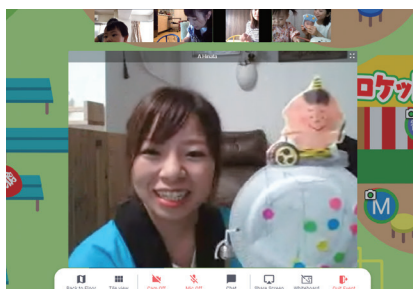
親子でデンデン太鼓をつくるコーナー

イベント当日は、在園児・卒園児枠と一般枠とで分け開催し、在園児10名、卒園児4名(兄弟児を含めると6名)、一般枠では熊本や神戸、名古屋など遠方からの参加も含め18名の子どもたちが参加しました。