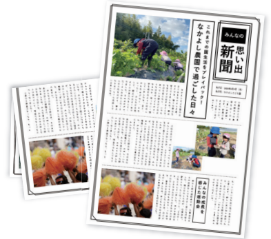
園全体の教育方針や園児の成長を発信

教育には情報発信が重要で、自園の保育方針を伝える「園だより」はその代表格です。従来の紙媒体だけでなく、連絡帳アプリやSNSなど、その発信手段は多様化しています。こうしたSNS時代においても、紙をあえて選ぶ園