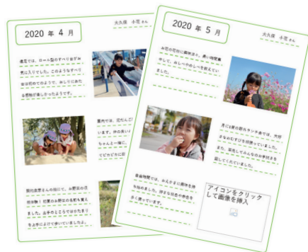
成長の記録を毎月ポートフォリオに

園独自の保育スタイルを実現できるのは、保護者の理解があるからこそ。中には、園児の成長を記録したポートフォリオを職員が協力してパソコンで毎月作成し、制作から保管までデータベースで一元管理している園があります。同園では、