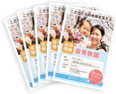
入園案内や採用チラシを内製

他園との差別化を意識し、園舎やWebサイトにこだわり、ブランディングに力を入れる園も増えてきました。そうした園の情報や想いをいち早く保護者や地域に届けようとしたときに、その情報が古くならないよう、