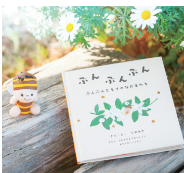
長坂養蜂場が制作した絵本

花を咲かせる植物に「実」がなる。その多くはミツバチの花粉交配によるものです。苺やメロン、みかんなど、私たちが日常で口にする食べ物多くはミツバチが運んでくれた恵みの「奇跡」です。