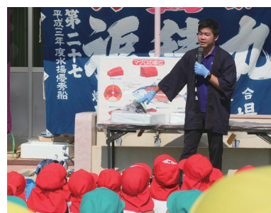
マグロの生態についても説明された

り組みは、焼津漁業協同組合が13年前から焼津市内の園で行っています。マグロはどのような形でのくらの大ききなのか、どのようにしてスパーで見るとグロの柵の形になるのかと、日頃自分が食べるものを知る機会として、これまで実