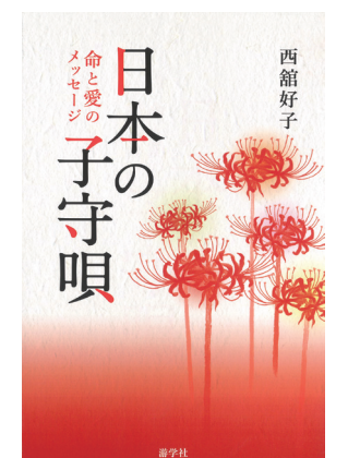
書籍「日本の子守唄 命と愛のメッセージ」(遊学社)

民謡の基本である子守唄。モノや情報に溢れ、それらをスマートフォンから便利に得られる時代だからこそ、昔から受け継がれてきた子守唄の必要性を唱える団体が、NPO法人日本子守唄協会（東京都台東区）です。「子守唄は地域ごとに口伝で残ってきたもの。そのため、歌の中には各地域の自然や風習が色濃く反映されている。そしてそれは、