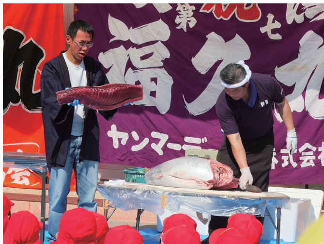
40kgのマグロが柵の形になる様子

40kgのマグロを園児たちの目の前で解体。あつという間にさばかれていく中、マグロは生涯泳ぎ続けるなど、生態についても話されま