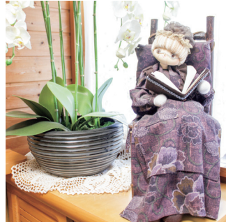
職員手製のシュタイナー人形

小紙8月号で紹介したこばと保育園（静岡県島田市）のように、わらべうたの伝承に注目が集まっています。