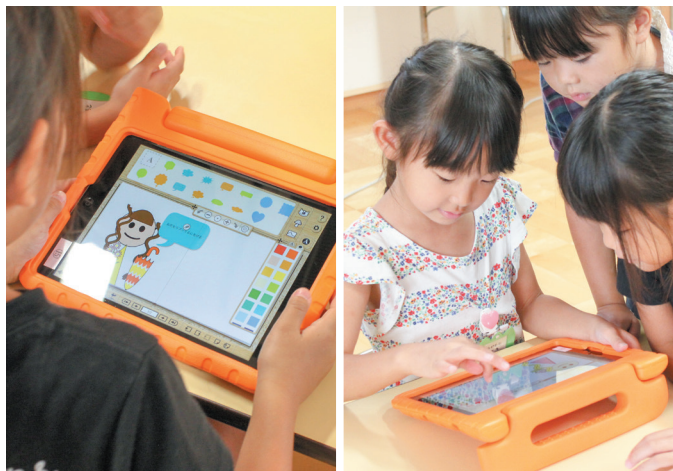
自分のイメージに合うように図形を組み合わせていく園児たち

教室「ICTたいむ」を試験導入しました。ICTたいむは、3C（コミュニケーション・コラボレーション・クリエイティブ）の力を育むことを目的に、教育ICTデザイナー・田中康平氏を中心