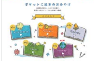
シロクマ親子のデジタル絵本「パパのたび」 https://goo.gl/4PFBXQ

〇一七年七月から一年間の期間限定で全五話を楽しむことができます。パパと一緒に手を伸ばした月がぴかぴかのラッパに変身する物語や、パパと