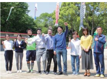
笑顔が素敵な先生たち

また、ネイティブの英語講師は常勤で、園の生活に溶け込んでいます。子どもたちを育む先生や保護者もまた、日々の生活の中で国際人を目指し、視野を広げています。