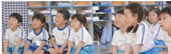
年中、年長ともに20名2クラスで英語教育活動を実施。講師と園児たちはすべての意思疎通を英語で行い、体を動かしたり歌を歌ったりしている

明青幼稚園では、言葉でコミュニケーションをはかること、多様性を認めることを大切に、日