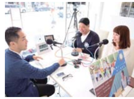
茶々保育園グループ自ら番組を発信