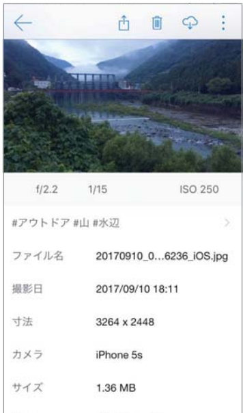
写真に自動でキーワードタグ付け

Googleは九月、パソコンにダウンロードして利用するアプリ「Googleドライブ」を、二〇一八年三月に終了することを発表しました。ただし、ブラウザやスマホから利用する分には、これまでと変わらず「Googleドライブ」が利用可能。パソコン版アプリに代わるサービスとして、「Googleドライブ」の機能が組み合わさった「Backup and Sync（バックアップと同期）」への移行を推奨しています。 今は写真をオンラインストレージサービスで管理する時代。やはり「Backup and Sync」のように、文書ファイルなどや写真をあえて分けずに保管するサービスが一般的になっています。大手サービスの「Dropbox」や「OneDrive」「Amazon Drive」などもこれに当てはまります。 管理場所だけでなく、管理方法もこれまでと変わり、「フォルダ分け」という概念がなくなり、フォルダ管理よりも写真一つひとつにタグを付けて、キーワード検索することで、お目当ての写真を探し出す感覚に。「Googleフォト」と「OneDrive」に至っては、自動的に写真にタグ付けをしてくれるため、わざわざタグを付ける手間さえも自動化されます。 しかし、無料のサービスは有料のものに比べてセキュリティのリスクがあることをあらかじめ理解しておくことが大事。また、タグ付けもリスクとなる場合があります（四面セキュリティピックを参照）。便利な点とリスクとなる点の二面性を理解した上で、ITツールを活用していきたいものです。