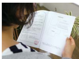
保護者が見やすい中とじの印刷物

業が全て自動化できました。事務員や先生からは「写真の再現性が高まった」「スキヤンの性能も良くなってコピーがきれい」と好評で、これまで百冊以上の冊子の丁合、折り、ステープル留めを複数人で行っていた手間もすべてなくなりました。「複数ページの端をステープルで留めるよりも、中とじの冊子の方が保護者にとって見やすい。しかも、手作業よりも紙揃えやステープル留めもきれいにできる」と棚橋副園長。保護者にとっての見やすさにこだわるとともに、きれいな印刷物をつくらうという情熱が感じられます。