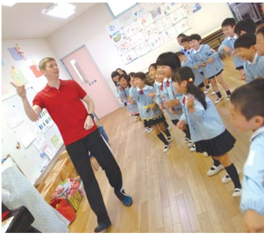
外国人講師に興味津々。好奇心溢れる表情で反応することもたち

情報社会が発展する中、世界各国との距離が縮まっています。二〇一六年度の訪日外国人数は二千万人、日本人出国数は一千七百万人と増加傾向にあり、東京オリンピックに向けて、グローバル教育や英語教育への関心は、さらに高まっています。 楽天リサーチ(株)が二〇一六年に実施した「日本人の英語に関する意識調査」(二十代〜六十代の男女千人対象)によると、「英語は苦手」との回答が七割に達しました。その一方で、ママ九百人に聞いた、習っている・習わ