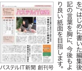
パステルIT新聞 創刊号

LINEやTwitter、ソーシャルメディアとインターネットを安全に楽しむための心構えが紹介されています。一七年初心者向けに、インターネットやSNSを安全に利用するための心構えが紹介されています。一七年初心者向けに、インターネットやSNSを安全に利用するための心構えが紹介されています。