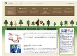
ここからセキュリティ!