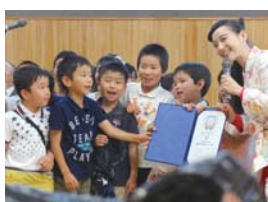
表彰される園児たち

品が入選。ビジュアルプログラミング言語「ビスケット」でつくられたアニメーション作品です。物語の中に、プログラムの特徴をうまく捉えたダイナミックな動きや、読み手を驚かせるような鮮やかさが表現されていると評価されました。受