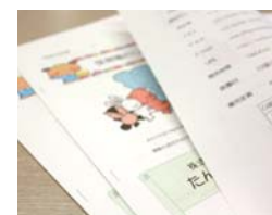
冊子のステーブル留めも自動化