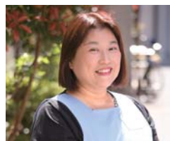
アスク系列保育園 上條園長