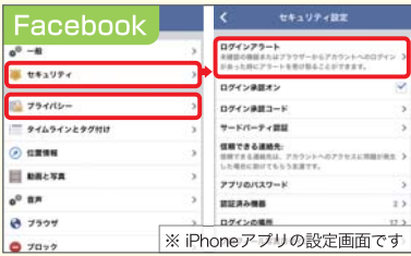
※ iPhoneアプリの設定画面です