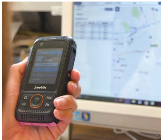
日常のバス送迎における職員間での情報共有にIP無線機を活用。より高度な地震速報で素早い判断を

3・11をきっかけに、「どうやってみんなの命を守るか」ということを突き詰めていった森川園長。「想定外」という言葉が飛び交った3・11から学び