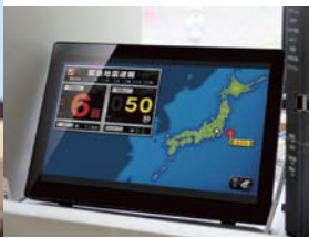
より高度な地震速報で素早い判断を

も。「より速く、より信頼性の高い機械を」ということで選びました。放送設備と連動し、園内どこでも速報を把握できます。併せて、IP無線機「3030e」(ジェイ・モバイル)伝を五台利用。ポタン一つで一斉通話ができること、GPSを利用して高度な地震速報を受信できること、大規模災害時に携帯電話や固定電話では繋がらなくなる一方、「3030e」は回線の規制や混雑がない専用