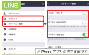
※ iPhoneアプリの設定画面です

「設定 - セキュリティ」の「ログインアラート」で未確認機器やブラウザからログインされたら通知を受けたり、「プライバシー」でつながりの詳細が指定できたりします。