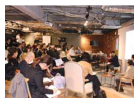
登壇者との距離が近く学びやすい

「形式的な言葉ではなく、園独自のお祝いの言葉が嬉しい」と、電報にまつわるエピソードから、今となってはあまり会えない人との思い出や縁が電報を通じてつながっていることがわかります。 また、「お祝いを頂いた方にはどのようにお礼を伝えていきますか?」という質問には、「手紙(二十九カ園、全体の四割)」が最も多い結果となりました(図3)。「ZINなどで気軽にメッセージを送れる時代ですが、電報や手紙は言葉を送る手法として今も思っています」。