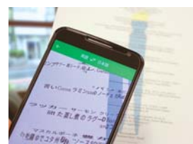
カメラをかざすと画面越しに翻訳

海外の旅行先でも案内板やメニューなどをリアルタイムに日本語訳できるようにになりました。 言語の壁が低くなることで、世界の国々をより身近に感じる人々がさらに増えそうです。