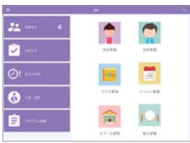
画面には利用する機能のみを表示

少子化・貧困化・二千人の減少・新制度。この業界に大きく影響する要素としてお伝えしています。これまで私立幼稚園が成功してきた経営モデルが通じなくなるを感じています。園児数を増やせないと、高い料金設定ができない、先生がいない。そして私学助成と新制度のアンバランス。先が読めない見えない状況の中で、不安を感じ答えを外に求めている方が増えているように思います。しかし、どうも外に答えはないようです。自分が答えを出すための参考にするには、自分自身の中にある答え、答えは内側にあるのです。やはり自分で決める