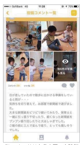
Pico ナーサリ久我山園の実践例

想いを込めて連絡帳を書きすぎる理由とは? 園に合うようになって先生たちがどれだけ忙しかのかがよくわかりました。そして、どんなときも子どもたちに目を配り、その時々表情を保護者に伝えようと、おたよりや連絡帳、ホワイトボードや掲示板などに向かい、熱心に手を動かしている姿に感動しました。 あんなに忙しいのに時間を惜しまず書きすぎるのはなぜだろう? その