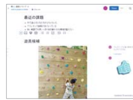
ドキュメントの右側にコメントも

増やせないと、高い料金設定ができない、先生がいない。そして私学助成と新制度のアンバランス。先が読めない見えない状況の中で、不安を感じ答えを外に求めている方が増えているように思います。しかし、どうも外に答えはないようです。自分が答えを出すための参考にするには、自分自身の中にある答え、答えは内側にあるのです。やはり自分で決める