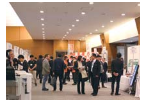
12のブースが並んだ出展コーナー

な思考や表現力を養う園向けカリキュラムの導入事例を紹介しました。第四講座は「職員や保護者とともに始めよう!時代に応じた教育・保育環境づくり」をテーマに学園経営コンサルタントの石田敦志氏が登壇。日本の未来予測に基づく園経営のありかた、園づくり