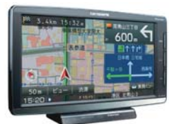
園バスの位置を園内のPCでリアルタイムに表示

園バスの運行では、乗車している園児の安全を確保するだけでなく、道路状況を熟知し、乗降場所を把握するなど、様々な場面で危険予測への配慮が求められる。運転手の負担は大きいもの。そんな負担を少しでも軽減すべく、カーナビやカーオーディオ製品で園内トップシェアを誇るパイオニア(株)は、園バスの運行管理に活用できるクラウド型の車両運行管理システム「ビークルアシスト」を提供しています。