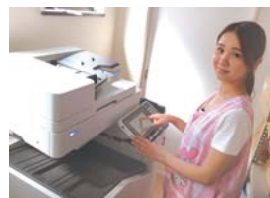
狭い空間で活躍するオルフィス

差がなく、簡単にフルカラー印刷できることから導入に踏み切りました。また、限られたスペースに設置できるプリンター本体のサイズも選んだ決め手となりました。電話線の配線の都合で、プリンターを手狭な職員室の裏部屋に設置せざるを得なかったのですが、これまでのオルフィスシリーズと比べて、オルフィスFWは幅と奥行きが小さく、設置することができました。