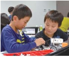
プログラボの様子

保護者には、自園の価値観とルールに共感してもらいたいこと。約束できない方は入園できないし、入園した後に約束を破られた時は破られて困っている事をしっかりと伝えましょう。「共感して破られた時は破られて困っている事をしっかりと伝えましょう。」