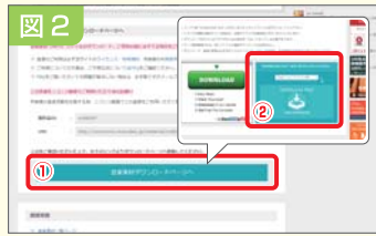
図2 気に入った素材があったら画面下の「音楽素材ダウンロードページへ」をクリック。(1)次に、「DOWNLOAD FILE」のボタンをクリックします。(2)ファイルを再生して確認しましょう。

図1 ファイル名やイメージ画像をクリックすると、再生画面が表示されます。音楽プレイヤーと同様の操作で、まずは試聴してみましょう。このとき再生時間も確認しておくで参考になります。