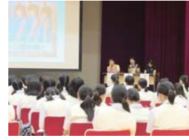
約150名の生徒が講話に耳を傾けた

幼児教育や保育の教育に力を入れ、今年四月に男子生徒としては最多の十四名の生徒が幼児教育・保育系進学コースに入學した貞静学園徳等学校(東京都文京区)。七月十三日、同校にて、(株)マイナビと13歳のハローワーク公式サイト企画・協力のもと、現役保育士による社会人講話とワークショップが実施されました。講師には(福)藤花学園北野保育園(東京都板橋区)の保育士二名が登場しました。