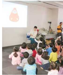
デジタルえほんの読み聞かせ (NPO法人 CANVAS)