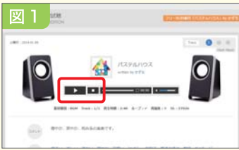
図1 ファイル名やイメージ画像をクリックすると、再生画面が表示されます。音楽プレイヤーと同様の操作で、まずは試聴してみましょう。このとき再生時間も確認しておくで参考になります。