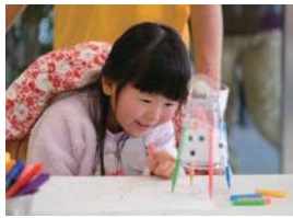
創作活動「お絵かきロボット」

NOCK(ノック)を発表しました。「新しい世界を開く(ノックする)」という意味が込められています。このプロジェクト第一弾として、ワークショップを基軸としたプログラムを各園に合わせた提供。「かんじる」「かんがえる」「つくる」「つたえる」とい