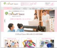
保育士の負担軽減を目指す

の事務業務を効率化するだけでなく、園児の成長に合わせた保育をサポートします。保育者は、タブレットから園児の成長記録を登録。全国四万人の園児の成長データをもとに、発達段階に応じたケアがサポートされます。さらに、指導計画の素案が自動作成され、指導計画の熟考に集中できるようになっています。詳しくは公式サイトにて。