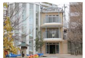
テラスから園庭の四季が楽しめる

楽しい時間の共有で信頼と思いやり育む 非日常の演出と空間づくり 昨年三月、千葉市の(学)笠川学園園生幼稚園に完成した別棟には、主用途のランチルームのほかに小規模保育所、子育て支援室、課外部屋やプラネタリウム空間などがあります。日常を大切に育む同園のコミュニケーションを取りました。