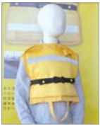
浮力体備えたバッグとして特許取得済み

「EATOTTE(フロートート)」はバッグとして日常的に持ち歩き、非常時には頭からかぶることのできる防災用品です。子どもたちが登下校時に津