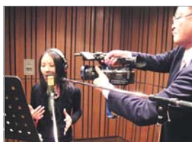
プロによる楽曲の制作が行われる

出版社 ひさかたチャイルド http://www.hisakata.co.jp/