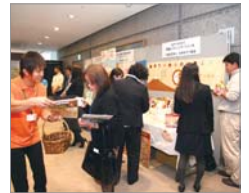
15社による商品が揃った展示会

また、園経営に特化した商品・サービスの展示会も同時開催。参加者は一堂に集まった商品の紹介に、じっくりと耳を傾けていました。