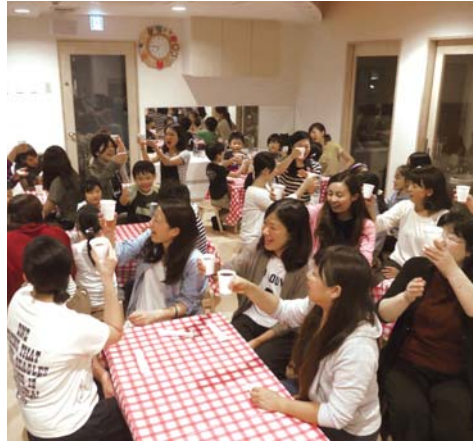
9月28日の神秘的な月夜にランチルームで開催された「スーパームーンコンサート」。幼稚園と保育園両チームの職員とその子どもたちが集まり、フルートの音色と交流を楽しんだ

住宅街の一角にある園生幼稚園。駐車場には2525ナンバーのネコバス。掲示板にはサンタの壁面飾り。どこからかクリスマスソングも聞こえてきます。時計付きの小窓から現れた守衛さんは不思議の国の住人のよう。そこには園生ワールドが広がっています。 園庭を挟んで園舎と向き合うランチルーム棟の中心には厨房付きの約六十名が集えるランチルームがあります。ピザ窯やコーヒーマシンも導入しました。「園児たちはもちろん、お母さんたちがお茶をしたり、テラスから子どもたちの様子を見守ったりもできる。九月のスーパームーンの夜に