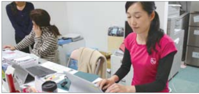
通園バスは朝夕2コースずつ。それぞれ約30名の園児たちが乗車。事務所からはバスの現在位置を確認

たとしても、保護者は遅れた時間に合わせて到着するため、各停留所での停車時間が長くなってしまっていました。しかし、導入後は保護者がバスの現在位置をリアルタイムにスマートフォンで確認。さらに運行状況に応じてバスの接近通知メールを受け取るなど、自らがパ