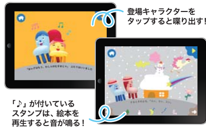
「I」が付いているスタンプは、絵本を再生すると音が鳴る!