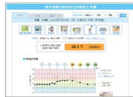
子どもが感じる暑さを確認

環境省は、「熱中症予防情報サイト」にて、大人や子どもが感じる暑さの違いや、駐車場や住宅地など、気温が特に変わると想定される場所ごとの現