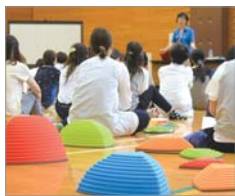
発達と絡めた遊び道具の紹介も