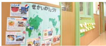
おいしいそうな食べ物の写真の掲示物。天井には「かもめ」が飛んでいる。日当たりの良い園庭の「かもめ農場」では野菜やハーブを育てる体験も