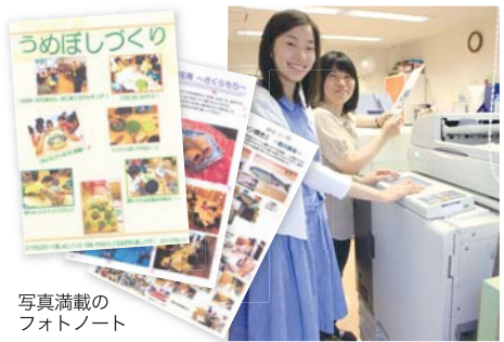
写真満載のフォトノート

掲示物やフォトノートは、理想科学工業の高速カラープリンター「オルフィス EX」で印刷。「食べ物の質感や園児たちの表情をより美しく表現するために、原稿づくりは、色数を落とすもきちんと色が出て、やわらかい雰囲気の色合いになるオルフィスの特徴を活かすように工