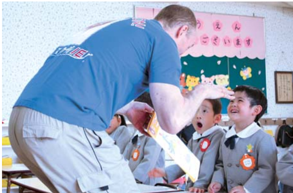
(上) 年中児のレッスン風景。数分刻みでリズムカルにカリキュラムが進行していく。子どもたちはその独特のリズム感の中で英語に楽しく親しんでいる様子 (左) ウィンビー公式キャラクター「タクティン」