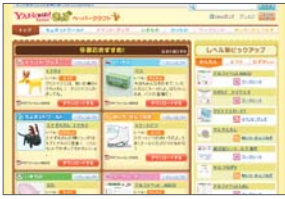
「Yahoo!きつず」ペーパークラフト

のほか、ニュースや季節の行事をわかりやすく解説したり、知的好奇心をくすぐったりするように、関連情報を紹介したりして、子どもたちが楽しく学ぶ機会を広げています。開設当初からの人気コーナーのひとつが「ペーパークラフト」です。節分には鬼のお面、パレнтаインデーにはカードひな祭りにはひな人形というように、季節のイベントに使えるグッズや飾りの素材(A4サイズ)