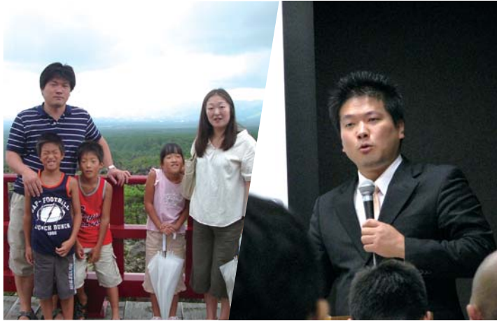
三つ子が誕生し、幼稚園の先生と出会ったことで現職の道に。子どもたちは現在5年生

前号に引き続き、十一月に東京国際フォーラムで開催された「選ばれる園づくりの 仕組み公開セミナー」のダイジェストです。今回は船井総合研究所の経営コンサル タント、石田敦志氏による「これから必要とされる幼稚園経営のスタンス」です。