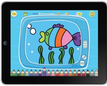
「ベビーおえかき」 開発元: Bi Hong Lin 価格: 無料 「AppStore」でアプリ名を検索しましょう。

色とりどりのクレヨンで絵を描き、フレームをつけて傑作をつくりましょう!自由に塗れる下絵も用意され、小さな子どもでもはみ出すことなくぬり絵を楽しめます。子どもが遊びやすくなる工夫がされ、おえかきを通して色彩感覚や想像力を育てられます。