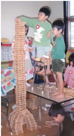
カプラのタワーを順番に積み上げる年中さん

▼大原野保育園 http://www.facebook.com/oharanohoikuen