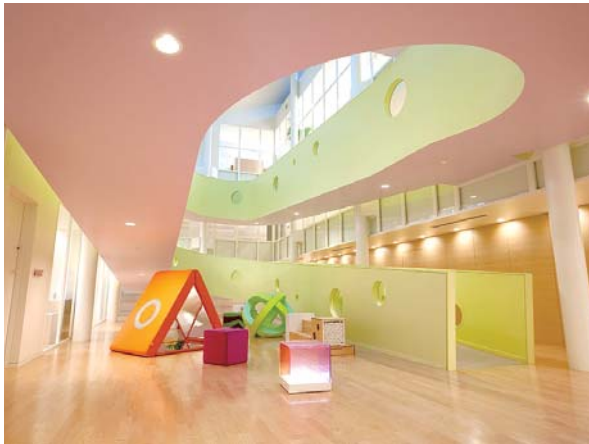
導入園のシンボリックな空間「広場」。「PLAY+soft」が配置されたことにより、色彩豊かでやさしい空間ができて、子どもたちや保護者を楽しませている

「子どもたちが過ごす空間を感性豊かに彩りたい。こんな思いをかたちにしてくれるアイテムとして注目されているのがココヨの「PLAY+soft(プレイビュースト)」。やわらかくて色鮮やか、ユニークなデザイン、遊具の魅力を取材しました。 イタリア生まれのプレイビューストは、デザインと教育学の対話から生まれた、子どもたちのため のやわらかい遊具。二〇一〇年に開園した東京都内の私立認可保育園にも導入されています。 同保育園では、子どもが生まれながらに持っている創造性を豊かに育む保育を実践しています。空間づくりも、その大切な要素のひとつです。園のシンボリックな空間である「広場」を中心に、〇一歳児室や多目的室などにもプレイビューストを導入したことで、施設全体でゆったりと子どもたちを包み込む空間が整いました。 やわらかくて立体的。しかも色彩やテクスチャーは多彩。もちろん環境にやさしく、耐火性にも優れ、何より安全なもの。子どもを育む空間には欠かせない数々の条件をクリアしたうえで、