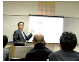
拓人HDスポーツ事業部の作間室長

学習塾や幼児教室の経営で成長著しい株式会社拓人は、二月二十七日、「園のブランドづくりセミナー」を同東京本社にて開催し、会場は園の経営