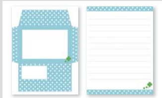
種類：PDF 拡張子：.pdf サイズ：約34KB 難易度：★☆☆☆☆

水玉模様の封筒と便箋のお手紙セットです。印刷すればそのまますぐに利用できるの、シールなどを貼ってアレンジしてみてくださいね。ちょっとした贈り物の際にもお使いください。