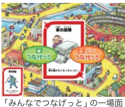
「みんなでつなげと」の一場面

れば、画面をじっと見ていただけで楽しそうな子、メロアイを口ずさむ子もいます。楽しみ方は様々なのです。「こうやってやるんだよ」。年中さんには年長さんがサポートしていました。順番待ちのルールも暗黙のうちに来てきたようです。新しいお友だちを受け入れるように、iPadを自然に受け入れている子どもたちなのです。