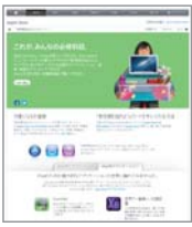
「新学期を始めよう」

新年度を前に、各社が学生を対象にした販促活動を展開する中、Appleも二月十四日より、新学期を始めるようキャンペーンを開始しています。これは、対象の学生や教職員が五月九日までに