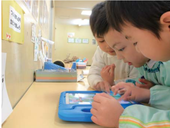
スマートエデュケーションのアプリ「おやこリズムタップ」を楽しむ園児たち。子どもたちの中で遊び方のルールが自然とできている

「先生、iPadを貸してください。」数人の男子たちが事務室にいる野口園長に声を掛けました。「はい、どうぞ。」手渡されたiPadを工作コーナーの机の上に静かに置くと、子どもたちは早速お気に入りのアプリ(ソフト)を起動しました。このiPadには一定の操作しかできないようにロックが掛けられています。子どもたちは「先生が使っているよ」とって言ったアプリだけで遊ぶ