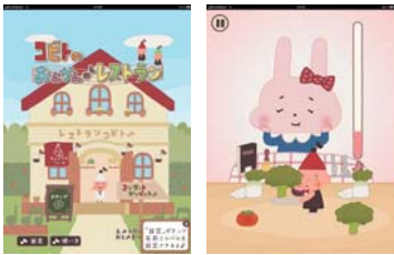
「コビトのおんかんレストラン」 開発元：ZAPPALLAS, INC. 価格：無料 「AppStore」でアプリ名を検索しましょう。

場面はレストラン。うさぎさんたちがメニューを見て何かをオーダーしますが聞こえてくるのは和音だけ。さあ、いったい何をオーダーしたのでしょうか？テーブルに並んでいるものから選び、食べさせてあげましょう。正解したかは、うさぎさんたちの表情に注目。1回だけしかオーダーしてくれないので、耳を澄ませて集中しましょう。