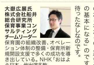
大嶽氏 一般社団法人 大嶽氏 一般社団法人 大嶽氏 一般社団法人

「セルフプロデュース」という言葉を聞いたことがありますか？自分をどう見せるか、どう見られたいかをイメージ・設定して、それに内面や外見を近づけていくことです。「プロデュース」といっても、プロのコーチやファッションアドバイザーに付いてもらうというわけではなく、お金をかけずに明日からすぐできることもあります。まずは、「見られたい自