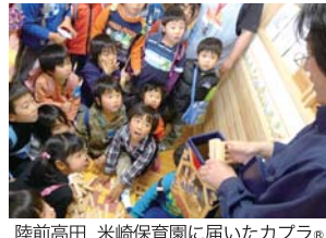
陸前高田 米崎保育園に届いたカプラ。

に遊び心を通わせることができるのです。今、日本中に「カプラ」の遊びの輪が広がっています。その遊びの輪を東北へつなげたい。「カプラで一緒に遊んだ楽しさを東北の子どもたちにも届けたい」との思いで、四月二十九日に東京おもちゃ美術館でチャリティーワークショップを開催します。参加費は全額カプラを東北へ贈る活動に充てられます。カプラがどこまでも橋をかけてゆけるように、カプラの日本総代理店として人と人の架け橋になりたいと願っています。どなたでもご参加できます。どうぞワークショップへお越しください。▼詳しくはこちらをご覧ください。http://www.goodtoy.org/thm/