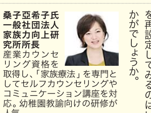
桑子氏 一般社団法人 桑子氏 一般社団法人 桑子氏 一般社団法人

態で、もしも何か頼まれたいのに「それは無理です」と答えている自分に気づいたら、ちぐはぐなことにハッとしますよね。もうすぐ新年度。新しい園児や保護者、新入りの先生たちとの出会いが待っているこの時期、もう一度「見られたい自分」を再設定してみるのはいかがでしょうか。