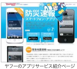
ヤフーのアプリサービス紹介ページ