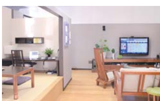
光HOUSE YOKOHAMAの「光の体感コーナー」

という声も聴かれました。さらに、園児の遊びについても音楽や図鑑などの教育アプリを試用したり、開発者の想いを聴いたりしたことで、「おもしろい」「子どもの反応が楽しみ」「視聴覚教材の選択肢に加えては?」など肯定的な意見が大半を占めました。