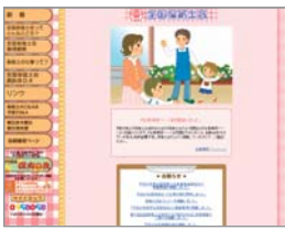
全国保育士会 Webサイト

ていきたいものです。 スマートフォンアプリ 「防災速報」は、豪雨予報 をプッシュ通知(アプリ を起動しなくてもリアル タイムなお知らせが画面 に表示される)で知らせ てくれます。豪雨予報の 他に、地震、津波、気象 放射線量などのチェック にも使えます。最大三つ の地域と災害種類を設定 すれば、自動的に災害情 報の予報・警報を速報し てくれます。