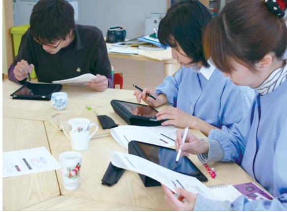
iPadを支給された先生たちが、園専用のコミュニティの試用をしている様子。画面をタッチして操作し、文字入力には表示されるキーボードから行う。