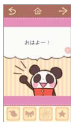
アプリ画面 画像を添付する形式で利用します。その他、Facebook、Twitter、SMS、MMSなどに

携帯電話でかわいいデザインメール(通称デコメ)をやりとりできるように、スマートフォンでもかわいい絵本のようなカードを作って送ることができ、アプリがあります。その名も「Feel on! POST」(フィールオンポスト)。こまぎのリーズン