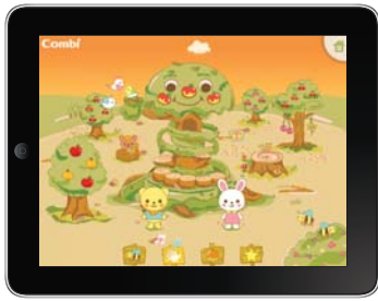
「ゆびであそぼう! コンビの森」

森のひろばに集まる仲間たちに触れるとジャンプをしたり、くると回ったり様々な反応をみせてくれます。時間帯で森の姿も変わり、夜はくまさんも眠りにつきます。指先での簡単な操作で遊べるので、小さな子どもたちでも楽しく指先を動かして遊べます。