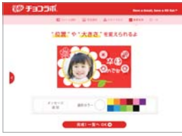
キットカットのパッケージデザイン

市販の菓子やそのパッケージに、写真やメッセージを入れられるサービスが増えています。インターネットでも気軽にデザインしてオリジナル菓子を注文できる商品のラインナップには、チョコレート、キットカット、ビスコなどおなじみの商品や、高級チョコレートメーカーであるメリーのチョコレート缶があります。