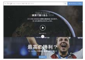
人気検索キーワードの特設サイト

人気アプリには、「Aco Upedo」「PunkKeeper」などの健康を気遣う人向けのアプリや「MixChannel」「Autodesk Pixlr」などの動画や写真加工アプリがランキングしました。YouTube上には、「YouTube Reward」チャンネルが用意され、人気動画を紹介。「アナと雪の女王」のミニ