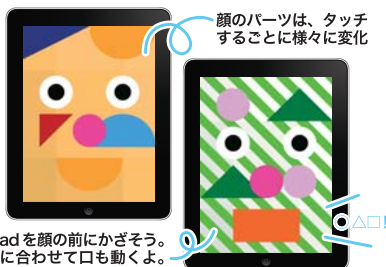
iPadを顔の前にかざそう。音に合わせて口も動くよ。

自分だけのお面をデザインできるアプリ。画面をタッチするだけでお面のパーツが変化します。デザインできたお面が表示されたiPadを顔の前に持ってきて話してみると、自分の声がワ!と驚く声に変身。節分行事に新しいお面遊びを取り入れてみては?