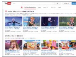
2014年人気動画を視聴

インターネット検索をはじめとし、動画視聴、アプリ、メール配信などの様々なサービスを提供しているグーグル。グーグルのサービスやイベントなどの最新情報を公開している公式ブログ「Google Blog」では、アプリや電