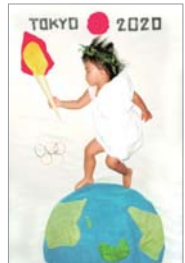
みやざわ氏の作品「オリンピック」

ママたちが赤ちゃんのかわいい寝姿を、物語のワンシーンのように演出して写真に収める「寝相アート」。