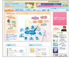
Webサイト「13歳のハローワーク」

二〇〇九年三月号で話題にした「『好き』から人生を切り開く13歳のハローワーク」に学ぶ「http://itnews.passtell.jp/new/s/802/Website/」13歳のハローワークでは、二〇一三年十二月の月間の人気職業ランキングで、「保育士」がまたしても一位となりました。「保育士」はランキング上位の常連になっています。