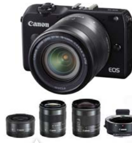
キヤノン製 ミラーレス一眼レフ EOS M2 (トリプルレンズキット) パステルショップ参考価格 ¥129,800(税込)

カードリーダーや付属のUSBケーブルを接続して写真をパソコンに転送します。最近ではWi-Fiで写真を転送する機能を持つカメラもあります。その場でスマートフォンに転送し、最速でWebサイトなどに公開することもできます。