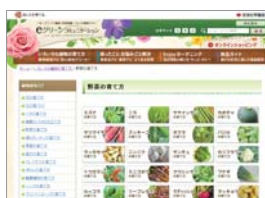
数十種類の野菜の育て方を掲載

ガーデニング・園芸・家庭菜園・くらしの情報サイト「eグリーンコミュニティ」は、花や野菜などの種類や育て方